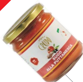
Sugo alla puttanesca 180 g (cartone 12 vasi)