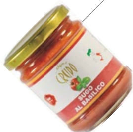
Sugo al basilico 180 g (cartone 12 vasi)