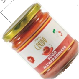
Sugo all'arrabbiata 180 g (cartone 12 vasi)