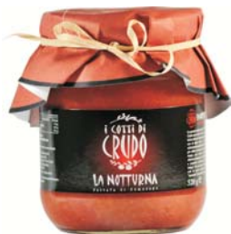
Passata "La Notturna" 520 g (cartone 12 vasi)