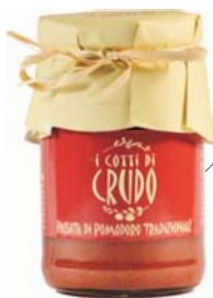
Passata tradizionale 270 g (cartone 12 vasi)